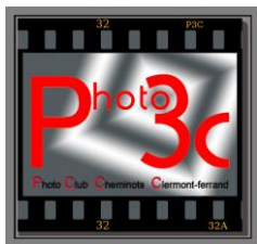
PHOTO CLUB CHEMINOTS CLERMONT